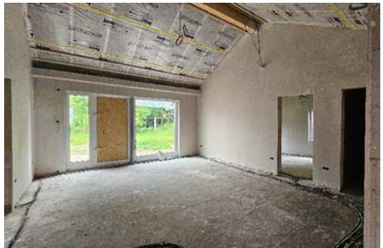
Gruppenraum mit Nebenraum