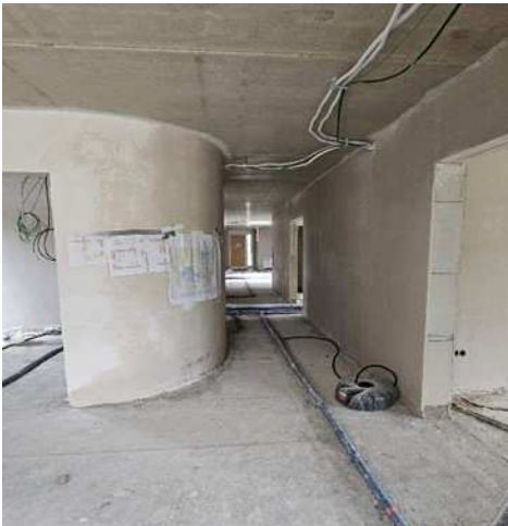
Rechter Flügel: Flurbereich mit Büro (links) und Turnhalle (rechts)

Elisabeth Woltering, Einrichtungsleitung